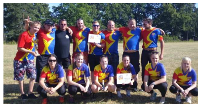
Družstvo mužů a žen po soutěži ve Chválenicích

Videa a fotografie z jednotlivých soutěží můžete shlédnout na našich webových stránkách WWW.SDHNEBILOVY.CZ v sekci GALERIE.