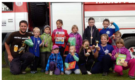
Družstvo mladších žáků a přípravy po soutěži v Plzni Hradišti 20. června 2015

Přestože mladí hasiči v Nebřilovech začali fungovat po dlouhých jedenácti letech, účastnily se děti v letošním roce již několika soutěží. První zkušenosti získávaly v Plzni Hradišti, kde místní SDH pořádalo v sobotu 20. června dětskou soutěž v požárním útoku. Mladší žáci Nebřilov zde obsadili výborné třetí místo s časem útoku 50,63 s. Soutěže se zúčastnilo i družstvo přípravy (děti do 6 let), které se utkalo s místními dětmi v disciplíně stříkání džberovkou a obsadilo druhé místo.